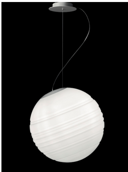
OSTRAS25 Stratosfera S25 sospensione