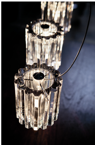
OCHAROS16 CHARLOTTE S6D sospensione