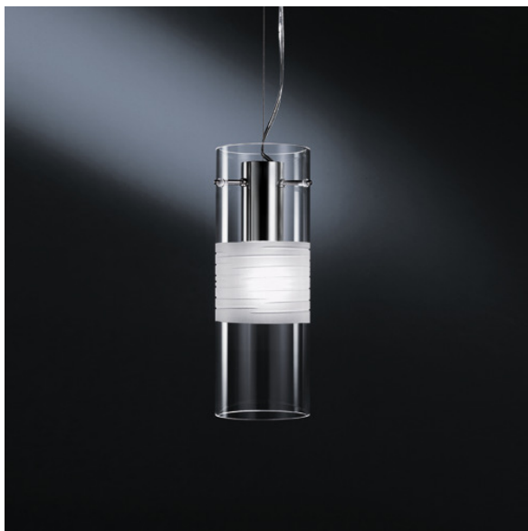
OXXILOS16 XXILO S6D sospensione decentrata