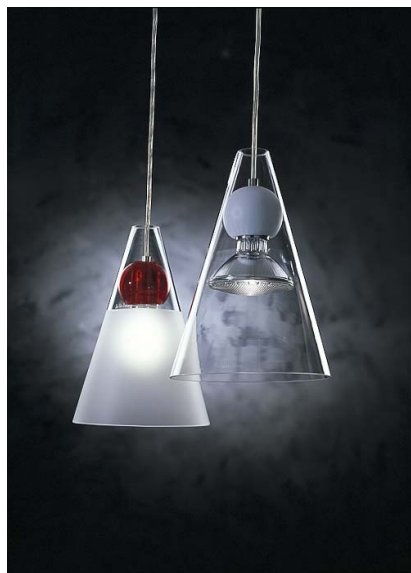
OGEMMOSD-2 GEMMA S2D sospensione decentrata