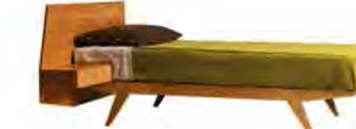
ART. 2884 LETTO GIÒ

MISURE: L 133 P 199 H 80 DESCRIZIONE: Letto con struttura in legno massello di ciliegio e supporto materasso in doghe. Testiera in legno con comodino integrato con cassetto. Finitura: F32/C. Design Centro Ricerche MAAM PESO: 55 kg - m³: 0,7 COLLI: 2