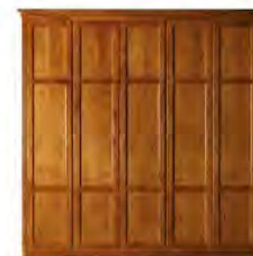
ART. 0375 GUARDAROBA DIRETTORIO

MISURE: L 269 P 64 H 266 DESCRIZIONE: armadio guardaroba a 5 ante in legno di ciliegio con pregiata fresatura sui fianchi e cornice di chiusura. Interno: 1 cassetiera a 3 cassetti, 5 ripiani regolabili e 5 aste appendiabiti. Accessori su richiesta: portacravatte, portapantaloni, cassaforte, appendiabiti inclinabile, specchio. Finitura: F40 Design Centro Ricerche MAMM PESO: 280 kg - m³: 1,7 - COLLI: 9 MEASURES: L 269 W 64 H 266 DESCRIPTION: wardrobe with 5 doors made of cherry wood with a fine milling on the sides and decorating frame. Inside: 1 chest of 3 drawers, 5 adjustable shelves and 5 clothes rails. Accessories on request: tie rack, trouser rack, electronic safe, lifting hanging, mirror. Finishing: F60. Design by centro Ricerche MAMM WEIGHT: 280 kg - m³: 1,7 - PIECES: 9