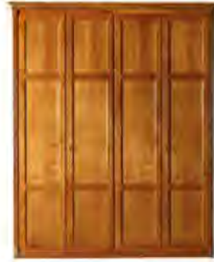
ART. 0376 GUARDAROBA DIRETTORIO

MISURE: L 219 P 64 H 266 DESCRIZIONE: Armadio guardaroba a 4 ante in legno di ciliegio con pregiata fresatura sui fianchi e cornice di chiusura. Interno: 1 cassetiera a 3 cassetti, 4 ripiani regolabili e 4 aste appendiabiti. Accessori su richiesta: portacravatte, portapantaloni, cassaforte, appendiabiti inclinabile, specchio. Finitura: F40 Design Centro Ricerche MAMM PESO: 255 kg - m 3 : 1,5 - COLLI: 8