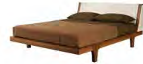
ART. 2880/N LETTO MALIBÙ

MISURE: L 180 P 230 H 90 DESCRIZIONE: letto in legno di noce canaletto con ampia testiera bifacciale, imbottita in pelle o tessuto. Supporto con doghe di legno. Tessuto occorrente: cm 180x140. Finitura: F32/N. Design Centro Ricerche MAAM PESO: 100 kg - m³: 1,3 - COLLI: 4