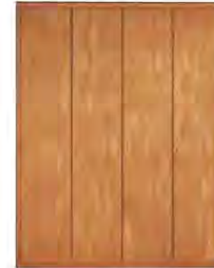
ART. 0364 GUARDAROBA '900

MISURE: L 210 P 59 H 264 DESCRIZIONE: armadio guardaroba a 4 ante in legno di ciliegio con pregiata impiallacciatura a venature disallineate. Interni: 1 cassetiera a 3 cassetti, 4 ripiani regolabili e 4 aste appendiabiti. Accessori su richiesta: portacravatte, portapantaloni, cassaforte, appendiabiti inclinabile, specchio. Finitura: F30 Design Centro Ricerche MAM PESO: 265 kg - m³: 1,5 - COLLI: 8 MEASURES: L 210 W 59 H 264 DESCRIPTION: wardrobe with 4 doors made of cherry wood with a fine grain misalignment. Inside: 1 chest of 3 drawers, 4 adjustable shelves and 4 clothes rails. Accessories on request: tie rack, trouser rack, electronic safe, lifting hanging, mirror. Finishing: F30 Design by centro Ricerche MAM WEIGHT: 265 kg - m³: 1,5 - PIECES: 8