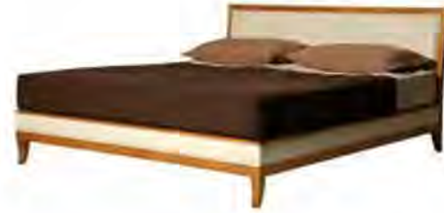
ART. 2885 LETTO BIEDERMEIER UMBERTO

MISURE: L 172 P 208 H 96 DESCRIZIONE: letto con struttura in legno di ciliegio, imbottita e rivestita come la testiera in pelle o tessuto. Supporto in doghe di legno. Tessuto occorrente: cm 390x140. Finitura: F34 Design Centro Ricerche MAM PESO: 67 kg - m³: 1 COLLI: 4