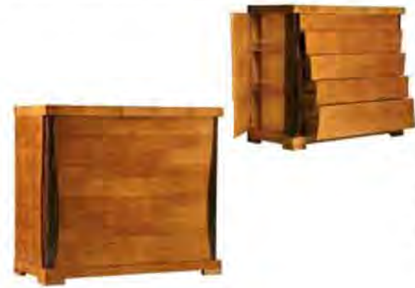
ART. 1265 COMÒ BIEDERMEIER TRIESTE

MISURE: L 125 P 57 H 110,5 DESCRIZIONE: comò a 5 cassetti in legno di ciliegio con colonne in Ebanò Makassar e pregiata impiallacciatura sulle superfici. Due ante a scomparsa sui fianchi nascondono due vani segreti. Finitura: F30. Design Centro Ricerche MAM PESO: 90 kg - m³: 0,85 - COLLI: 1