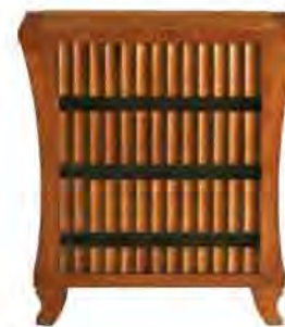
ART. 1362 COMODINO BIEDERMEIER

MISURE: L 56 P 40 H 60 DESCRIZIONE: comodino in legno di ciliegio con fresatura a lesene sui 3 cassetti e pregiato intarsio in palissandro. Finitura: F40 Design Centro Ricerche MAM PESO: 26 kg - m³: 0,17 COLLI: 1