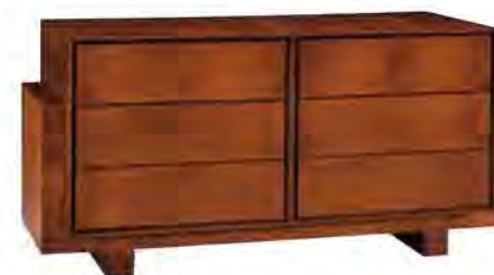
ART. 1256 COMÒ '900 SCACCHI

MISURE: L 161 P 57 H 79 DESCRIZIONE: comò a 6 cassetti della collezione Zero con struttura in legno di ciliegio a 2 vani e basamento con gambe intagliate. Su richiesta in legno di noce canaletto. Finitura: F60 Design Centro Ricerche MAMM PESO: 86 kg - m 3 : 0,87 - COLLI: 1