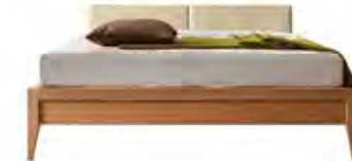
ART. 2892 LETTO VALENTINO

MISURE: L 208 P 183 H 80,5 DESCRIZIONE: letto in legno di ciliegio con testiera imbottita in pelle o tessuto. Supporto in doghe di legno. Finitura: F32/C. Design Centro Ricerche MAAM PESO: 85 kg - m³: 1,05 COLLI: 4