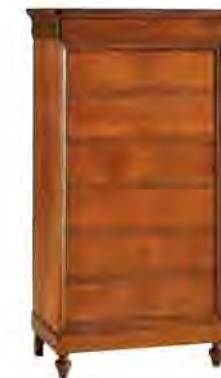
ART. 0808 CASSETTIERA LUIGI FILIPPO

MISURE: L 82 P 45 H 154 DESCRIZIONE: comò a 7 cassetti con chiusura a chiave in legno di ciliegio. Piano sagomato e gambette tornite. Finitura: F60 Design Centro Ricerche MAM PESO: 77 kg - m³: 0,65 COLLI: 1