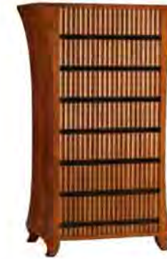
ART. 0831 CASSETTIERA BIEDERMEIER

MISURE: L 90 P 45 H 140 DESCRIZIONE: comò in legno di ciliegio con fresatura a lesene sui 7 cassetti e pregiato intarsio in palissandro. Finitura: F40 Design Centro Ricerche MAM PESO: 75 kg - m³: 0,7 COLLI: 1