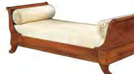
ART. 2816 LETTO LUIGI FILIPPO

MISURE: L 98 P 227 H 78 DESCRIZIONE: letto in legno di ciliegio con testiera e pediera in legno e gambette sagomate. Supporto in doghe di legno. Finitura: F60 Design Centro Ricerche MAM VANO INTERNO: L 90 P 195 PESO: 60 kg - m³: 0,5 - COLLI: 3