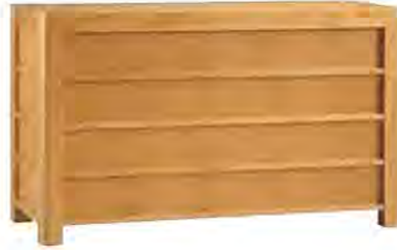
ART. 1260 COMÒ '900 IMPERIA

MISURE: L 135 P 55 H 82 DESCRIZIONE: comò in legno di ciliegio con 4 cassetti incavati e particolare bordino in rilievo sulle maniglie. Gambe a sezione quadrata con spigolo smussato e pregiata venatura sulle superfici. Finitura: F30. Design Centro Ricerche MAAM PESO: 80 kg - m 3 : 0,8 - COLLI: 1