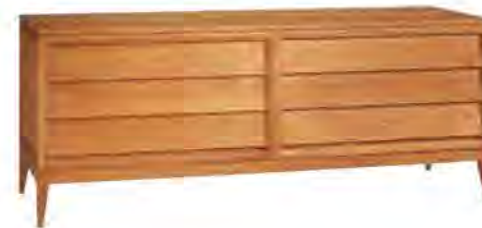
ART. 1254 COMÒ '900 NEW YORK

MISURE: L 206 P 54 H 79 DESCRIZIONE: comò a 6 cassetti in legno di ciliegio con gambe a spillo e frontali dei cassetti spioventi, tipica lavorazione della collezione '900. Finitura: F30 Design Centro Ricerche MAAM PESO: 98 kg - m 3 : 0,95 - COLLI: 1