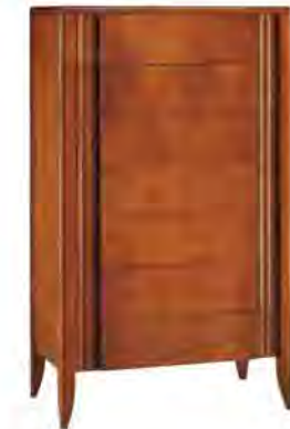
ART. 0830 CASSETTIERA '900 RULMAN

MISURE: L 85 P 45 H 140 DESCRIZIONE: Comò a 7 cassetti in legno di ciliegio con pregiata venatura e controfresatura a lesene sui lati dei cassetti. Finitura: F60 Design Centro Ricerche MAAM PESO: 72 kg - m 3 : 0,62 - COLLI: 1