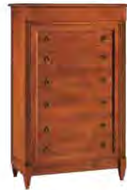
ART. 0829 CASSETTIERA DIRETTORIO

MISURE: L 89 P 45 H 140 DESCRIZIONE: comò a 7 cassetti in legno di ciliegio. 6 cassetti con maniglie e 1 a scomparsa sotto il piano. Finitura: F60 Design Centro Ricerche MAM PESO: 77 kg - m³: 0,83 COLLI: 1