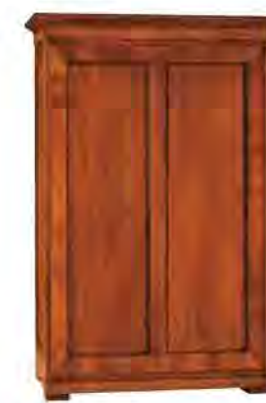
ART. 0301 ARMADIO BIEDERMEIER

MISURE: L 137 P 62 H 205 DESCRIZIONE: armadio a 2 ante per composizioni su misura con una cassetiera a 2 cassetti interna e 1 ripiano con appendiabiti. Finitura: F60 Design Centro Ricerche MAMM PESO: 118 kg - m³: 2,3 - COLLI: 2 MEASURES: L 137 W 62 H 205 DESCRIPTION: two-door modular element for wardrobe compositions made of cherry wood with 1 chest of drawers, 1 shelf and clothes rail. Finishing: F60 Design by centro Ricerche MAMM WEIGHT: 118 kg - m³: 2,3 - PIECES: 2