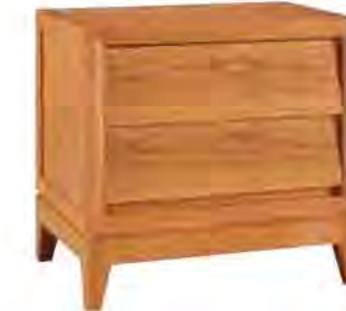
ART. 1361 COMODINO '900 NEW YORK

MISURE: L 55 P 38 H 55 DESCRIZIONE: comodino a 2 cassetti in legno di ciliegio con gambe a spillo e frontali dei cassetti spioventi, tipica lavorazione della collezione '900. Finitura: F30 Design Centro Ricerche MAAM PESO: 20 kg - m 3 : 0,16 COLLI: 1