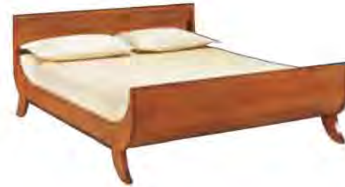
ART. 2869 LETTO BIEDERMEIER

MISURE: L 176 P 210 H 90 DESCRIZIONE: letto con struttura in legno di ciliegio e profilo inferiore intarsiato in legno di palissandro. Pregiata fresatura a lesene sulla testiera. Supporto in doghe di legno. Finitura: F40 VANO INTERNO: L 170 P 195 Design Centro Ricerche MAM PESO: 110 kg - m³: 1 - COLLI: 4