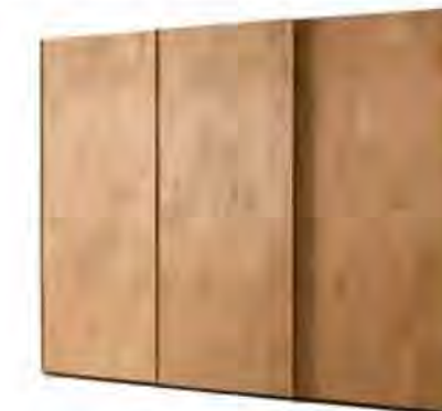
ART. 0371 GUARDAROBA '900

MISURE: L 303 P 65 H 263 DESCRIZIONE: armadio guardaroba a 3 ante scorrevoli in legno di ciliegio con pregiata impiallacciatura a venature disallineate. Interno: 1 cassetiera a 3 cassetti, 5 ripiani regolabili e 5 aste appendiabiti. Accessori su richiesta: portacravatte, portapantaloni, cassaforte, appendiabiti inclinabile, specchio. Finitura: F32/C Design Centro Ricerche MAM PESO: 330 kg - m³: 1,8 - COLLI: 9 MEASURES: L 303 W 65 H 263 DESCRIPTION: wardrobe with 3 sliding doors made of cherry wood with a fine grain misalignment. Inside: 1 chest of 3 drawers, 5 adjustable shelves and 5 clothes rails. Accessories on request: tie rack, trouser rack, electronic safe, lifting hanging, mirror. Finishing: F32/C Design by centro Ricerche MAM WEIGHT: 330 kg - m³: 1,8 - PIECES: 9