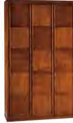
ART. 0349 GUARDAROBA '900 SCACCHI

MISURE: L 158 P 59 H 264 DESCRIZIONE: armadio guardaroba a 3 ante in legno di ciliegio con pregiata lavorazione a "scacchiera" e impiallacciatura a venature contrapposte. Interno: 1 cassetiera a 3 cassetti, 4 ripiani regolabili e 4 aste appendiabiti. Accessori su richiesta: portacravatte, portapantaloni, cassaforte, appendiabiti inclinabile, specchio. Finitura: F60 Design Centro Ricerche MAMM PESO: 225 kg - m³: 1,2 - COLLI: 8 MEASURES: L 158 W 59 H 264 DESCRIPTION: wardrobe with 3 doors made of cherry wood with a fine checkerboard decoration. Inside: 1 chest of 3 drawers, 4 adjustable shelves and 4 clothes rails. Accessories on request: tie rack, trouser rack, electronic safe, lifting hanging, mirror. Finishing: F60 Design by centro Ricerche MAMM WEIGHT: 225 kg - m³: 1,2 - PIECES: 8