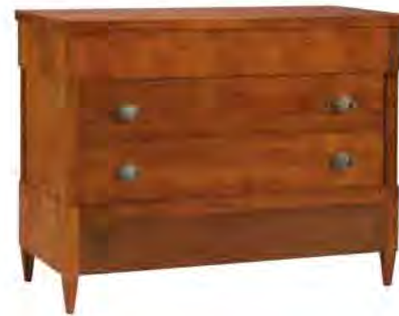
ART. 1261 COMÒ BIEDERMEIER

MISURE: L 124 P 55 H 100 DESCRIZIONE: comò a 4 cassetti in legno di ciliegio. Due cassetti con maniglia in ottone, uno inferiore a scomparsa e 1 cassetto con apertura a ribalta sotto il piano con piano scrittoio in pelle rivestito e 3 cassettoni interni portaoggetti. Finitura: F60 Design Centro Ricerche MAM PESO: 90 kg - m³: 0,8 - COLLI: 1