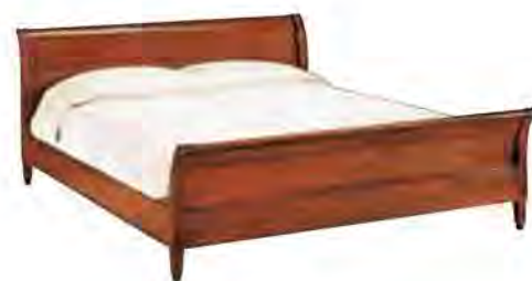
ART. 2840 LETTO DIRETTORIO

MISURE: L 181 P 226 H 90 DESCRIZIONE: letto in legno di ciliegio con testiera e pediera sagomati. Su richiesta con testiera imbottita. Supporto in doghe di legno. Finitura: F60 Design Centro Ricerche MAMM VANO INTERNO: L 170 P 195 PESO: 95 kg - m 3 : 1 - COLLI: 3