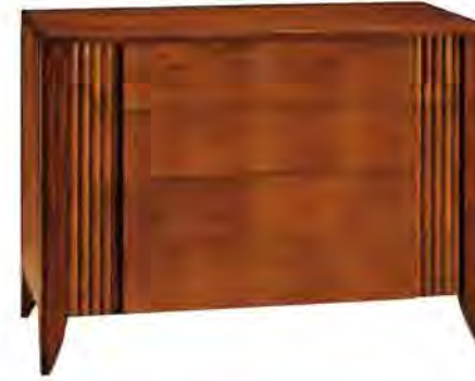
ART. 1257 COMÒ '900 RULMAN

MISURE: L 125 P 53 H 90 DESCRIZIONE: Comò a 4 cassetti in legno di ciliegio con pregiata venatura e controfresatura a lesene sui lati dei cassetti. Su richiesta in legno di noce canaletto. Finitura: F60 Design Centro Ricerche MAAM PESO: 77 kg - m 3 : 0,78 - COLLI: 1