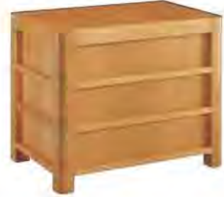
ART. 1359 COMODINO '900 IMPERIA

MISURE: L 60 P 40 H 50 DESCRIZIONE: comodino in legno di ciliegio con 3 cassetti incavati e particolare bordino in rilievo sulle maniglie. Gambe a sezione quadrata con spigolo smussato e pregiata venatura sulle superfici. Finitura: F30 Design Centro Ricerche MAAM PESO: 23 kg - m 3 : 0,2 - COLLI: 1