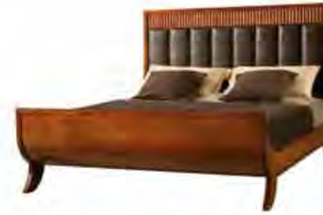
ART. 2874 LETTO BIEDERMEIER

MISURE: L 177 P 210 H 131 DESCRIZIONE: letto con struttura in legno di ciliegio e profilo inferiore intarsiato in legno di palissandro. Testiera imbottita in pelle o tessuto con pregiata fresatura a lesene. Supporto in doghe di legno. Tessuto occorrente: cm 240x140. Finitura: F40. Design Centro Ricerche MAM VANO INTERNO: L 170 P 195 PESO: 125 kg - m³: 1,2 - COLLI: 4