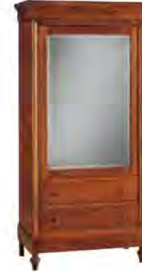
ART. 0302 ARMADIO LUIGI FILIPPO

MISURE: L 98 P 54 H 200 DESCRIZIONE: armadietto ad 1 porta a specchio con appendiabiti interno. 2 cassetti a vista ed 1 cassetto a scomparsa. Su richiesta porta a vetro o in legno. Finitura: F60 Design Centro Ricerche MAMM PESO: 82 kg - m³: 1,2 - COLLI: 1 MEASURES: L 98 W 54 H 200 DESCRIPTION: one-door cabinet with mirror, 2 drawers and 1 hidden small drawer. Inside clothing rail. Upon request wooden or glass door. Finishing: F60 Design by centro Ricerche MAMM WEIGHT: 82 kg - m³: 1,2 - PIECES: 1