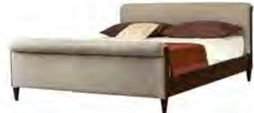
ART. 2806 LETTO FORTUNATO

MISURE: L 180 P 230 H 95 DESCRIZIONE: letto imbottito con struttura in legno di ciliegio. Imbottitura in pelle o tessuto su testiera e pediera. Supporto con doghe di legno. Finitura: F80. Design Centro Ricerche MAAM PESO: 80 kg - m³: 1 - COLLI: 4