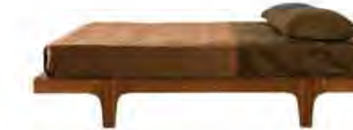
ART. 2882/N SOMMIER MALIBÙ

MISURE: L 180 P 205 H 31 DESCRIZIONE: letto sommier in legno di noce canaletto. Supporto con doghe di legno. Finitura: F32/N. Design Centro Ricerche MAAM PESO: 60 kg - m³: 1 COLLI: 3