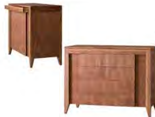
ART. 1269/N COMÒ '900 ANERIO

MISURE: L 125 P 55 H 97 DESCRIZIONE: comò in legno di noce canaletto a 4 cassetti più 1 cassetto nascosto sotto il piano. Fronte dei cassetti a venatura contrapposta tra parti in rilievo. Su richiesta in legno di ciliegio. Finitura: F32/N Design Centro Ricerche MAMM PESO: 84 kg - m 3 : 0,8 - COLLI: 1