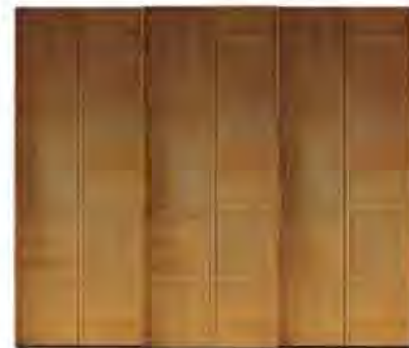
ART. 0372 GUARDAROBA '900

MISURE: L 303 P 65 H 263 DESCRIZIONE: armadio guardaroba a 3 ante scorrevoli in legno di ciliegio con pregiata lavorazione a "scacchiera" e impiallacciatura a venature contrapposte. Interno 1 cassetiera a 3 cassetti, 5 ripiani regolabili e 5 aste appendiabiti. Accessori su richiesta: portacravatte, portapantaloni, cassaforte, appendiabiti inclinabile, specchio. Finitura: F32/C Design Centro Ricerche MAMM PESO: 330 kg - m³: 1,8 - COLLI: 9 MEASURES: L 303 W 65 H 263 DESCRIPTION: wardrobe with 3 sliding doors made of cherry wood with a fine checkerboard decoration. Inside 1 chest of 3 drawers, 5 adjustable shelves and 5 clothes rails. Accessories on request: tie rack, trouser rack, electronic safe, lifting hanging, mirror. Finishing: F32/C Design by centro Ricerche MAMM WEIGHT: 330 kg - m³: 1,8 - PIECES: 9