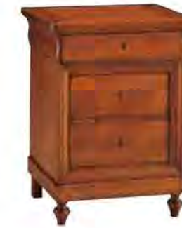
ART. 1327 COMODINO LUIGI FILIPPO

MISURE: L 50 P 38 H 67 DESCRIZIONE: comodino a 3 cassetti con chiusura a chiave in legno di ciliegio. Piano sagomato e gambette tornite. Finitura: F60 Design Centro Ricerche MAM PESO: 25 kg - m³: 0,15 COLLI: 1