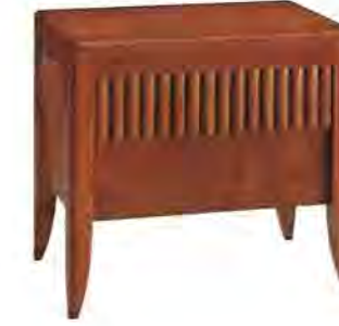
ART. 1356 COMODINO '900 RULMAN

MISURE: L 57 P 39 H 52 DESCRIZIONE: comodino a 2 cassetti in legno di ciliegio con pregiata venatura e controfresatura a lesene sul cassetto superiore. Su richiesta in legno di noce canaletto. Finitura: F60 Design Centro Ricerche MAAM PESO: 22 kg - m 3 : 0,16 - COLLI: 1