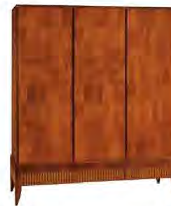
ART. 0367 ARMADIO '900 RULMAN

MISURE: L 188 P 63 H 216 DESCRIZIONE: armadietto in legno di ciliegio a 3 ante con pregiata impiallacciatura a venature disallineate. Interno: 2 ripiani e 2 appendiabiti, 3 cassetti a scomparsa nel basamento con controfresatura a lesene. Finitura: F60 Design Centro Ricerche MAMM PESO: 224 kg - m³: 1,5 - COLLI: 6 MEASURES: L 188 W 63 H 216 DESCRIPTION: wardrobe made of cherry wood with 3 doors and 3 drawers. Doors veneered with a fine grain misalignment while drawers are decorated with a prestigious milling. Inside: 2 shelves and 2 clothes rails. Finishing: F60 Design by centro Ricerche MAMM WEIGHT: 224 kg - m³: 1,5 - PIECES: 6