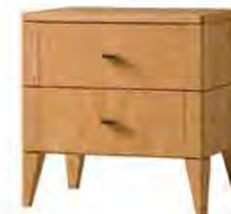
ART. 1365 COMODINO '900 VITTORIO

MISURE: L 55 P 40 H 55 DESCRIZIONE: comodino a 3 cassetti in legno di ciliegio con maniglie in pelle e ottone. Gambe a stiletto con particolare fresatura sui fianchi. Su richiesta in legno di noce canaletto. Finitura: F32/C Design Centro Ricerche MAMM PESO: 24 kg - m 3 : 0,18 - COLLI: 1