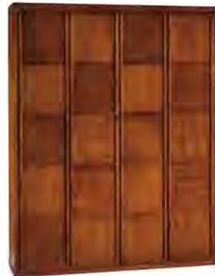
ART. 0332 GUARDAROBA '900 SCACCHI

MISURE: L 210 P 59 H 264 DESCRIZIONE: armadio guardaroba a 4 ante in legno di ciliegio con pregiata lavorazione a "scacchiera" e impiallacciatura a venature contrapposte. Interno: 1 cassetiera a 3 cassetti, 4 ripiani regolabili e 4 aste appendiabiti. Accessori su richiesta: portacravatte, portapantaloni, cassaforte, appendiabiti inclinabile, specchio. Finitura: F60 Design Centro Ricerche MAMM PESO: 275 kg - m³: 1,5 - COLLI: 8 MEASURES: L 210 W 59 H 264 DESCRIPTION: wardrobe with 4 doors made of cherry wood with a fine checkerboard decoration. Inside: 1 chest of 3 drawers, 4 adjustable shelves and 4 clothes rails. Accessories on request: tie rack, trouser rack, electronic safe, lifting hanging, mirror. Finishing: F60 Design by centro Ricerche MAMM WEIGHT: 275 kg - m³: 1,5 - PIECES: 8