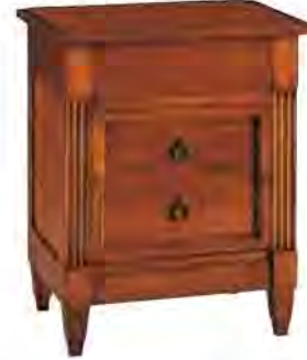
ART. 1348 COMODINO DIRETTORIO

MISURE: L 54 P 38 H 64 DESCRIZIONE: comodino a 3 cassetti in legno di ciliegio. 2 cassetti con maniglie e 1 a scomparsa sotto il piano. Finitura: F60 Design Centro Ricerche MAM PESO: 22 kg - m³: 0,15 COLLI: 1