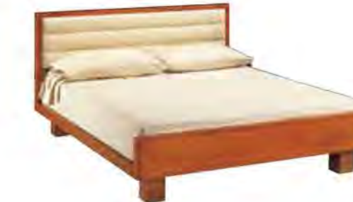
ART. 2849 LETTO '900 SCACCHI

MISURE: L 175 P 209 H 95 DESCRIZIONE: letto con struttura in legno di ciliegio e testiera imbottita in pelle o tessuto. Gambe fresate a sezione quadrata. Supporto in doghe di legno. Finitura: F30. Design Centro Ricerche MAAM VANO INTERNO: L 170 P 195 PESO: 100 kg - m³: 1,05 - COLLI: 3