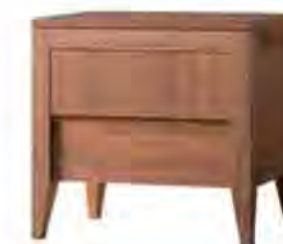
ART. 1366/N COMODINO '900 ANERIO

MISURE: L 57 P 40 H 55 DESCRIZIONE: comodino in legno di noce canaletto a 2 cassetti. Fronte dei cassetti a venatura contrapposta tra parti in rilievo. Su richiesta in legno di ciliegio. Finitura: F32/N Design Centro Ricerche MAMM PESO: 24 kg - m 3 : 0,16 - COLLI: 1