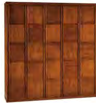
ART. 0331 GUARDAROBA '900 SCACCHI

MISURE: L 260 P 59 H 264 DESCRIZIONE: armadio guardaroba a 5 ante in legno di ciliegio con pregiata lavorazione a "scacchiera" e impiallacciatura a venature contrapposte. Interno: 1 cassetiera a 3 cassetti, 5 ripiani regolabili e 5 aste appendiabiti. Accessori su richiesta: portacravatte, portapantaloni, cassaforte, appendiabiti inclinabile, specchio. Finitura: F60 Design Centro Ricerche MAMM PESO: 295 kg - m³: 1,7 - COLLI: 9 MEASURES: L 260 W 59 H 264 DESCRIPTION: Wardrobe with 5 doors made of cherry wood with a fine checkerboard decoration. Inside: 1 chest of 3 drawers, 5 adjustable shelves and 5 clothes rails. Accessories on request: tie rack, trouser rack, electronic safe, lifting hanging, mirror.