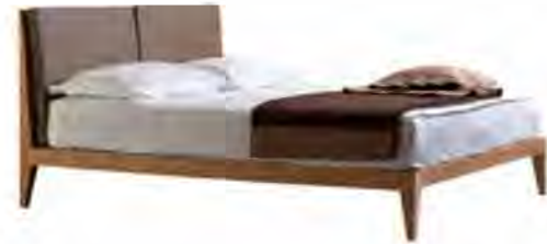
ART. 2890 LETTO FELICE

MISURE: L 207 P 175 H 101 DESCRIZIONE: Letto con struttura in legno di ciliegio e piedini con bordo stondato. Testiera a doghe di legno con 2 cuscini removibili, imbottiti e sfoderabili in pelle o tessuto. Supporto con doghe di legno. Finitura: F32/C. Design Centro Ricerche MAAM PESO: 85 kg - m³: 1 - COLLI: 3