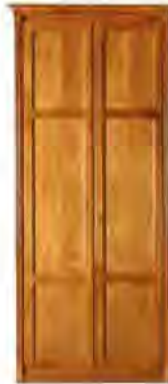
ART. 0378 GUARDAROBA DIRETTORIO

MISURE: L 117 P 64 H 266 DESCRIZIONE: armadio guardaroba a 2 ante in legno di ciliegio con pregiata fresatura sui fianchi e cornice di chiusura. Interno: 1 cassetiera a 3 cassetti, 2 ripiani regolabili e 2 aste appendiabiti. Accessori su richiesta: portacravatte, portapantaloni, cassaforte, appendiabiti inclinabile, specchio. Finitura: F40 Design Centro Ricerche MAMM PESO: 170 kg - m 3 : 1 - COLLI: 6