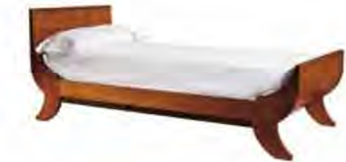
ART. 2868 LETTO BIEDERMEIER

MISURE: L 97 P 210 H 90 (Disponibile con misure: L 120) DESCRIZIONE: letto con struttura in legno di ciliegio e profilo inferiore intarsiato in legno di palissandro. Pregiata fresatura a lesene sulla testiera. Supporto in doghe di legno. Finitura: F40 Design Centro Ricerche MAM VANO INTERNO: L 90 P 195 PESO: 55 kg - m³: 0,5 - COLLI: 3