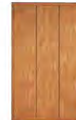
ART. 0365 GUARDAROBA '900

MISURE: L 158 P 59 H 264 DESCRIZIONE: armadio guardaroba a 3 ante in legno di ciliegio con pregiata impiallacciatura a venature disallineate. Interno: 1 cassetiera a 3 cassetti, 4 ripiani regolabili e 4 aste appendiabiti. Accessori su richiesta: portacravatte, portapantaloni, cassaforte, appendiabiti inclinabile, specchio. Finitura: F30 Design Centro Ricerche MAM PESO: 225 kg - m³: 1,2 - COLLI: 8 MEASURES: L 158 W 59 H 264 DESCRIPTION: wardrobe with 3 doors made of cherry wood with a fine grain misalignment. Inside: 1 chest of 3 drawers, 4 adjustable shelves and 4 clothes rails. Accessories on request: tie rack, trouser rack, electronic safe, lifting hanging, mirror. Finishing: F30 Design by centro Ricerche MAM WEIGHT: 225 kg - m³: 1,2 - PIECES: 8