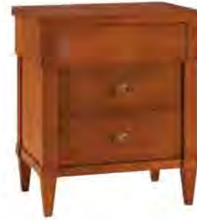
ART. 1354 COMODINO BIEDERMEIER

MISURE: L 54 P 38 H 64 DESCRIZIONE: comodino in legno di ciliegio con 3 cassetti. Finitura: F60 Design Centro Ricerche MAM PESO: 20 kg - m³: 0,18 COLLI: 1