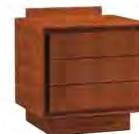
ART. 1357 COMODINO '900 SCACCHI

MISURE: L 49 P 42 H 53 DESCRIZIONE: comodino a 3 cassetti della collezione Zero con struttura in legno di ciliegio e basamento con frontale intagliato. Su richiesta in legno di noce canaletto. Finitura: F60 Design Centro Ricerche MAMM PESO: 22 kg - m 3 : 0,15 - COLLI: 1