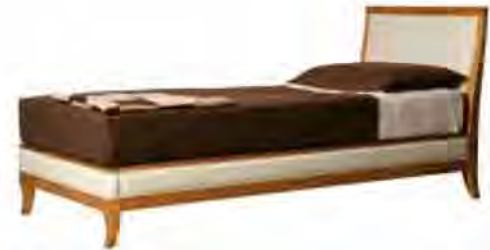
ART. 2886 LETTO BIEDERMEIER UMBERTO

MISURE: L 90 P 208 H 96 (Disponibile con misure: L 120) DESCRIZIONE: letto con struttura in legno di ciliegio, imbottita e rivestita come la testiera in pelle o tessuto. Supporto in doghe di legno. Tessuto occorrente: cm 250x140. Finitura: F34 Design Centro Ricerche MAM PESO: 46 kg - m³: 0,5 - COLLI: 3