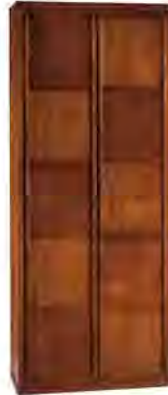
ART. 0348 GUARDAROBA '900 SCACCHI

MISURE: L 108 P 59 H 264 DESCRIZIONE: Armadio guardaroba a 2 ante in legno di ciliegio con pregiata lavorazione a "scacchiera" e impiallacciatura a venature contrapposte. Interno: 1 cassetiera a 3 cassetti, 2 ripiani regolabili e 2 aste appendiabiti. Accessori su richiesta: portacravatte, portapantaloni, cassaforte, appendiabiti inclinabile, specchio. Finitura: F60 Design Centro Ricerche MAMM PESO: 170 kg - m³: 1 - COLLI: 6 MEASURES: L 108 W 59 H 264 DESCRIPTION: Wardrobe with 2 doors made of cherry wood with a fine checkerboard decoration. Inside: 1 chest of 3 drawers, 2 adjustable shelves and 2 clothes rails. Accessories on request: tie rack, trouser rack, electronic safe, lifting hanging, mirror. Finishing: F60. Design by centro Ricerche MAMM WEIGHT: 170 kg - m³: 1 - PIECES: 6