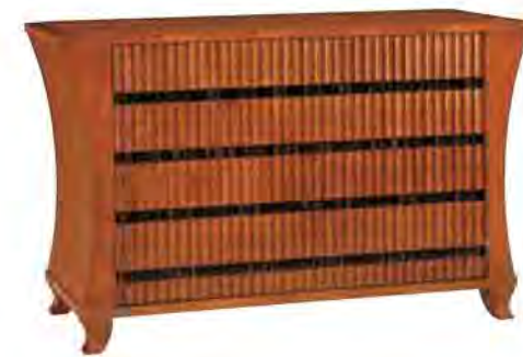
ART. 1258 COMÒ BIEDERMEIER

MISURE: L 138 P 54 H 86 DESCRIZIONE: comò in legno di ciliegio con fresatura a lesene sui 4 cassetti e pregiato intarsio in palissandro. Finitura: F40 Design Centro Ricerche MAM PESO: 90 kg - m³: 0,84 COLLI: 1