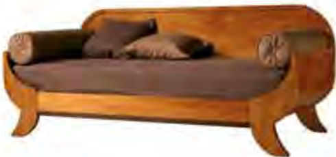
ART. 2873 LETTO BIEDERMEIER

MISURE: L 210 P 97 H 86 DESCRIZIONE: letto con schienale e struttura in legno di ciliegio e profilo inferiore intarsiato in legno di palissandro. Supporto in doghe di legno. Finitura: F40 Design Centro Ricerche MAM VANO INTERNO: L 90 P 195 PESO: 65 kg - m³: 0,5 - COLLI: 4