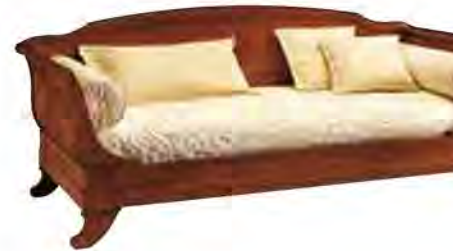
ART. 2821 LETTO LUIGI FILIPPO

MISURE: L 98 P 227 H 91 DESCRIZIONE: letto in legno di ciliegio con testiera, pediera e schienale in legno e gambette sagomate. Supporto in doghe di legno. Finitura: F60 Design Centro Ricerche MAM VANO INTERNO: L 90 P 195 PESO: 74 kg - m³: 0,85 - COLLI: 4