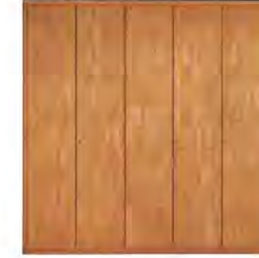
ART. 0363 GUARDAROBA '900

MISURE: L 260 P 59 H 264 DESCRIZIONE: armadio guardaroba a 5 ante in legno di ciliegio con pregiata impiallacciatura a venature disallineate. Interno: 1 cassetiera a 3 cassetti, 5 ripiani regolabili e 5 aste appendiabiti. Accessori su richiesta: portacravatte, portapantaloni, cassaforte, appendiabiti inclinabile, specchio. Finitura: F30 Design Centro Ricerche MAM PESO: 295 kg - m³: 1,7 - COLLI: 9 MEASURES: L 260 W 59 H 264 DESCRIPTION: wardrobe with 5 doors made of cherry wood with a fine grain misalignment. Inside: 1 chest of 3 drawers, 5 adjustable shelves and 5 clothes rails. Accessories on request: tie rack, trouser rack, electronic safe, lifting hanging, mirror. Finishing: F30 Design by centro Ricerche MAM WEIGHT: 295 kg - m³: 1,7 - PIECES: 9