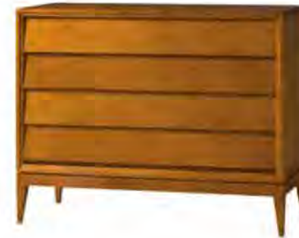
ART. 1271 COMÒ '900 NEW YORK

MISURE: L 125 P 54 H 100 DESCRIZIONE: comò a 4 cassetti in legno di ciliegio con gambe a spillo e frontali dei cassetti spioventi, tipica lavorazione della collezione '900. Finitura: F30 Design Centro Ricerche MAAM PESO: 70 kg - m 3 : 0,8 - COLLI: 1