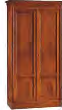
ART. 0341 ARMADIO DIRETTORIO MODULARE

MISURE: L 112 P 61 H 206 MISURE SENZA CORNICE: L 103 P 56,5 H 197 DESCRIZIONE: armadio a 2 ante per composizioni su misura con ripiano regolabile e appendiabiti. Finitura: F60 Design Centro Ricerche MAMM PESO: 74 kg - m 3 : 1,4 - COLLI: 2