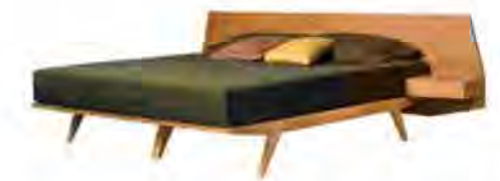
ART. 2887 LETTO GIÒ

MISURE: L 263 P 199 H 80 DESCRIZIONE: Letto con struttura in legno massello di ciliegio e supporto materasso in doghe. Testiera in legno con 2 comodini con cassetto integrati. Finitura: F32/C. Design Centro Ricerche MAAM PESO: 114 kg - m³: 2,5 COLLI: 3