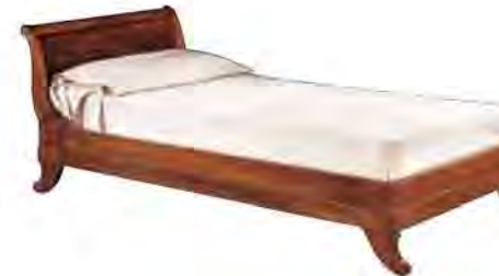
ART. 2846 LETTO LUIGI FILIPPO

MISURE: L 98 P 220 H 78 (Disponibile con misure: L 120) DESCRIZIONE: letto in legno di ciliegio con testiera in legno e gambette sagomate. Supporto in doghe di legno. Finitura: F60 Design Centro Ricerche MAM VANO INTERNO: L 90 P 195 PESO: 60 kg - m³: 0,5 - COLLI: 3