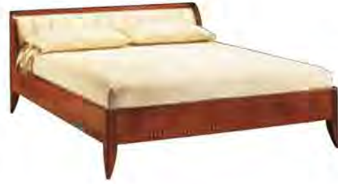
ART. 2850 LETTO '900 RULMAN

MISURE: L 176 P 215 H 92 DESCRIZIONE: letto in legno di ciliegio con pregiata fresatura delle sponde e testiera imbottita bifacciale. Tessuto occorrente: cm 260x140. Finitura: F60 Design Centro Ricerche MAM VANO INTERNO: L 170 P 195 PESO: 95 kg - m³: 1,05 - COLLI: 4