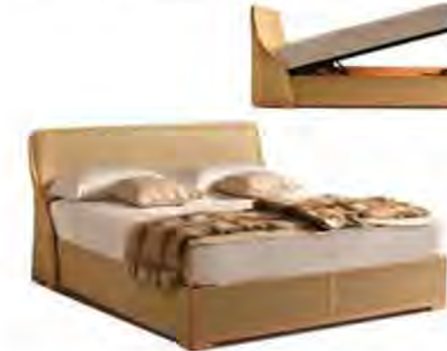
ART. 2801 LETTO ORLANDO

MISURE: L 190 P 216 H 102 DESCRIZIONE: letto con vano contenitore in legno di ciliegio e pelle. Testiera bifacciale con profilo in legno sagomato ad elica. Supporto materasso estraibile in doghe di legno. Finitura: F32/C. Design Centro Ricerche MAAM PESO: 110 kg - m³: 2 - COLLI: 5