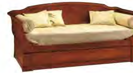
ART. 2822 LETTO LUIGI FILIPPO

MISURE: L 98 P 227 H 97 DESCRIZIONE: letto in legno di ciliegio con testiera e pediera in legno. Secondo letto singolo estraibile a cassettoni. 2 supporti in doghe di legno. Finitura: F60. Design Centro Ricerche MAM VANO INTERNO 1° LETTO: L 90 P 195 INGOMBRO 2° LETTO: L 85 P 203 VANO INTERNO 2° LETTO: L 80 P 190 PESO: 113 kg - m³: 1 - COLLI: 4