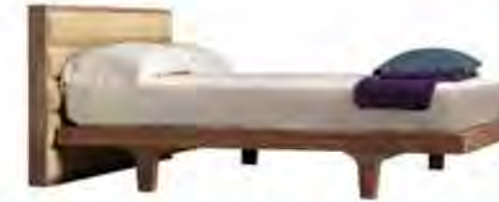
ART. 2894/N LETTO MALIBÙ

MISURE: L 217,5 P 190 H 91 DESCRIZIONE: letto in legno di noce canaletto con ampia testiera fissata a parete imbottita in pelle o tessuto. Supporto con doghe di legno. Su richiesta testiera a misura. Finitura: F32/N. Design: Centro Ricerche MAAM PESO: 100 kg - m³: 1,3 - COLLI: 4