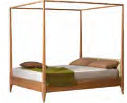
ART. 2891 LETTO VALENTINO CON BALDACCHINO

MISURE: L 208 P 183 H 209 DESCRIZIONE: letto in legno di ciliegio con testiera imbottita in pelle o tessuto e struttura a baldacchino. Supporto in doghe di legno. Finitura: F32/C. Design Centro Ricerche MAAM PESO: 100 kg - m³: 1 COLLI: 5