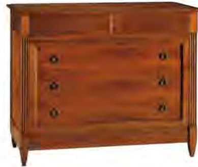
ART. 1243 COMO DIRETTORIO

MISURE: L 125 P 54 H 100 DESCRIZIONE: Comò a 5 cassetti in legno di ciliegio. 3 cassetti con maniglie e 2 a scomparsa sotto il piano. Finitura: F60 Design Centro Ricerche MAM PESO: 72 kg - m³: 0,8 COLLI: 1