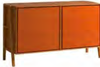
ART. 1267 COMÒ ZERO CAVALLETTA

MISURE: L 143 P 53 H 87 DESCRIZIONE: comò a 6 cassetti della collezione Zero con struttura in legno di ciliegio a 2 vani art. 3471, cassettiere art. 3495 e frontali art. 3498 con gambe "cavalletto". Finiture: struttura F30 e cassetti FL90. Design Centro Ricerche MAAM PESO: 70 kg - m 3 : 0,7 - COLLI: 1