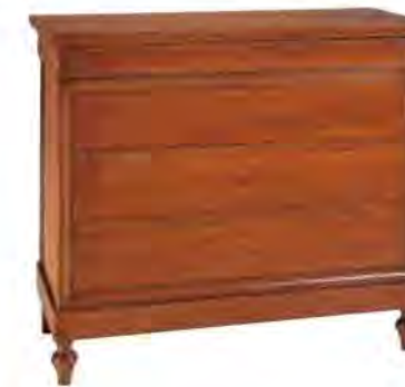
ART. 1244 COMÒ LUIGI FILIPPO

MISURE: L 115 P 54 H 98 DESCRIZIONE: comò a 4 cassetti con chiusura a chiave in legno di ciliegio. Piano sagomato e gambette tornite. Finitura: F60 Design Centro Ricerche MAM PESO: 65 kg - m³: 0,7 COLLI: 1