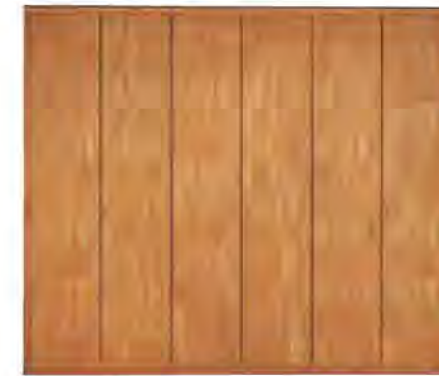
ART. 0362 GUARDAROBA '900

MISURE: L 309 P 59 H 264 DESCRIZIONE: armadio guardaroba a 6 ante in legno di ciliegio con pregiata impiallacciatura a venature disallineate. Interno: 1 cassetiera a 3 cassetti, 5 ripiani regolabili e 5 aste appendiabiti. Accessori su richiesta: portacravatte, portapantaloni, cassaforte, appendiabiti inclinabile, specchio. Finitura: F30 Design Centro Ricerche MAM PESO: 330 kg - m³: 1,8 - COLLI: 10 MEASURES: L 309 W 59 H 264 DESCRIPTION: wardrobe with 6 doors made of cherry wood with a fine grain misalignment. Inside: 1 chest of 3 drawers, 5 adjustable shelves and 5 clothes rails. Accessories on request: tie rack, trouser rack, electronic safe, lifting hanging, mirror. Finishing: F30 Design by centro Ricerche MAM WEIGHT: 330 kg - m³: 1,8 - PIECES: 10