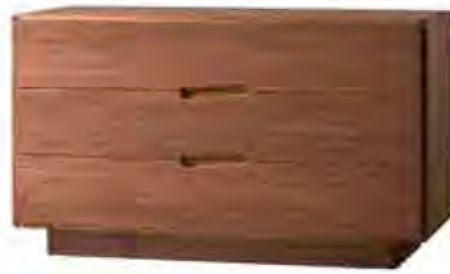
ART. 1272/N COMÒ MALIBÙ

MISURE: L 130,5 P 55 H 76,5 DESCRIZIONE: comò a 3 cassetti in legno di noce canaletto, con guide metalliche. Particolare la struttura ad angoli smussati e le maniglie intagliate in diagonale. Finitura: F32/N. Design Centro Ricerche MAAM PESO: 73 kg - m 3 : 0,65 - COLLI: 1