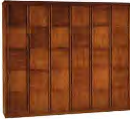
ART. 0327 GUARDAROBA '900 SCACCHI

MISURE: L 309 P 59 H 264 DESCRIZIONE: armadio guardaroba a 6 ante in legno di ciliegio con pregiata lavorazione a "scacchiera" e impiallacciatura a venature contrapposte. Interno: 1 cassetiera a 3 cassetti, 5 ripiani regolabili e 5 aste appendiabiti. Accessori su richiesta: portacravatte, portapantaloni, cassaforte, appendiabiti inclinabile, specchio. Finitura: F60 Design Centro Ricerche MAMM PESO: 330 kg - m³: 1,8 - COLLI: 10 MEASURES: L 309 W 59 H 264 DESCRIPTION: wardrobe with 6 doors made of cherry wood with a fine checkerboard decoration. Inside: 1 chest of 3 drawers, 5 adjustable shelves and 5 clothes rails. Accessories on request: tie rack, trouser rack, electronic safe, lifting hanging, mirror. Finishing: F60. Design by centro Ricerche MAMM WEIGHT: 330 kg - m³: 1,8 - PIECES: 10