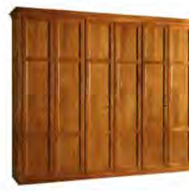
ART. 0374 GUARDAROBA DIRETTORIO

MISURE: L 318 P 64 H 266 DESCRIZIONE: Armadio guardaroba a 6 ante in legno di ciliegio con pregiata fresatura sui fianchi e cornice di chiusura. Interno: 1 cassetiera a 3 cassetti, 5 ripiani regolabili e 5 aste appendiabiti. Accessori su richiesta: portacravatte, portapantaloni, cassaforte, appendiabiti inclinabile, specchio. Finitura: F4 Design Centro Ricerche MAMM PESO: 300 kg - m³: 1,8 - COLLI: 10 MEASURES: L 318 W 64 H 266 DESCRIPTION: Wardrobe with 6 doors made of cherry wood with a fine milling on the sides and decorating frame. Inside: 1 chest of 3 drawers, 5 adjustable shelves and 5 clothes rails. Accessories on request: tie rack, trouser rack, electronic safe, lifting hanging, mirror. Finishing: F60 Design by centro Ricerche MAMM WEIGHT: 300 kg - m³: 1,8 - PIECES: 10