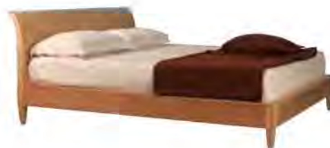
ART. 2847 LETTO DIRETTORIO

MISURE: L 181 P 215 H 90 DESCRIZIONE: letto in legno di ciliegio con testiera sagomata. Su richiesta con testiera imbottita. Supporto in doghe di legno. Finitura: F32/C Design Centro Ricerche MAMM VANO INTERNO: L 170 P 195 PESO: 80 kg - m 3 : 1 - COLLI: 3