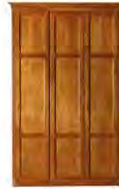
ART. 0377 GUARDAROBA DIRETTORIO

MISURE: L 167 P 64 H 266 DESCRIZIONE: armadio guardaroba a 3 ante in legno di ciliegio con pregiata fresatura sui fianchi e cornice di chiusura. Interno: 1 cassetiera a 3 cassetti, 4 ripiani regolabili e 4 aste appendiabiti. Accessori su richiesta: portacravatte, portapantaloni, cassaforte, appendiabiti inclinabile, specchio. Finitura: F40 Design Centro Ricerche MAMM PESO: 228 kg - m 3 : 1,2 - COLLI: 7