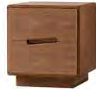
ART. 1367/N COMODINO MALIBÙ

MISURE: L 50 P 42 H 47 DESCRIZIONE: comodino a 2 cassetti in legno di noce canaletto, con guide metalliche. Particolare la struttura ad angoli smussati e le maniglie intagliate in diagonale. Finitura: F32/N. Design Centro Ricerche MAAM PESO: 27 kg - m 3 : 0,15 - COLLI: 1