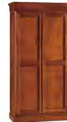
ART. 0337 ARMADIO LUIGI FILIPPO MODULARE

MISURE: L 109 P 60 H 206 MISURE SENZA CORNICE: L 103 P 56,5 H 197 DESCRIZIONE: armadio a 2 ante per composizioni su misura con ripiano regolabile e appendiabiti. Finitura: F60 VARIANTI A RICHIESTA: l'allestimento interno può essere modificato a richiesta del cliente. Design Centro Ricerche MAMM PESO: 82 kg - m³: 1,4 - COLLI: 2 MEASURES: L 109 W 60 H 206 MEASURES WITHOUT TOP FRAME: L 103 W 56,5 H 197 DESCRIPTION: Two-door modular element for wardrobe compositions made of cherry wood with adjustable shelf and clothes rail. Finishing: F60 ON REQUEST: the internal disposition may be changed on customer requirement. Design by centro Ricerche MAMM WEIGHT: 82 kg - m³: 1,4 - PIECES: 2