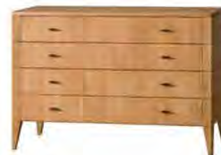
ART. 1268 COMÒ '900 VITTORIO

MISURE: L 125 P 55 H 87 DESCRIZIONE: comò a 4 cassetti in legno di ciliegio con maniglie in pelle e ottone. Gambe a stiletto con particolare fresatura sui fianchi. Su richiesta in legno di noce canaletto. Finitura: F32/C Design Centro Ricerche MAMM PESO: 80 kg - m 3 : 0,75 - COLLI: 1