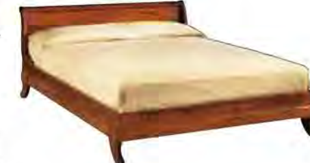
ART. 2834 LETTO LUIGI FILIPPO

MISURE: L 175 P 220 H 78 DESCRIZIONE: letto in legno di ciliegio con testiera in legno e gambette sagomate. Supporto in doghe di legno. Finitura: F60 Design Centro Ricerche MAM VANO INTERNO: L 170 P 195 PESO: 80 kg - m³: 1 COLLI: 3