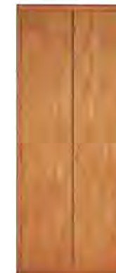
ART. 0366 GUARDAROBA '900

MISURE: L 108 P 59 H 264 DESCRIZIONE: armadio guardaroba a 2 ante in legno di ciliegio con pregiata impiallacciatura a venature disallineate. Interno: 1 cassetiera a 3 cassetti, 2 ripiani regolabili e 2 aste appendiabiti. Accessori su richiesta: portacravatte, portapantaloni, cassaforte, appendiabiti inclinabile, specchio. Finitura: F30 Design Centro Ricerche MAM PESO: 185 kg - m³: 1 - COLLI: 6 MEASURES: L 108 W 59 H 264 DESCRIPTION: wardrobe with 2 doors made of cherry wood with a fine grain misalignment. Inside: 1 chest of 3 drawers, 2 adjustable shelves and 2 clothes rails. Accessories on request: tie rack, trouser rack, electronic safe, lifting hanging, mirror. Finishing: F30 Design by centro Ricerche MAM WEIGHT: 185 kg - m³: 1 - PIECES: 6