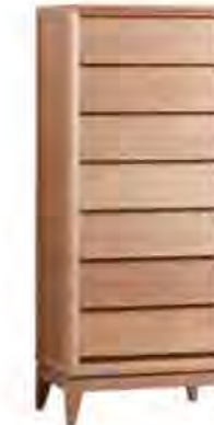
ART. 0801 CASSETTIERA '900 NEW YORK

MISURE: L 55 P 38 H 131 DESCRIZIONE: cassettiere a 7 cassetti in legno di ciliegio con gambe a spillo e frontali dei cassetti spioventi, tipica lavorazione della collezione '900. Finitura: F32/C Design Centro Ricerche MAAM PESO: 30 kg - m 3 : 0,5 - COLLI: 1