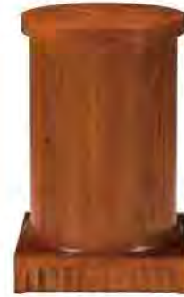
ART. 1360 COMODINO BIEDERMEIER COLONNA

MISURE: L 44 P 44 H 64 DESCRIZIONE: comodino a colonna in legno di ciliegio con 1 antina a battente e vano interno con ripiano. Fresatura a lesene sul basamento. Finitura: F40 Design Centro Ricerche MAM PESO: 17 kg - m³: 0,2 COLLI: 1