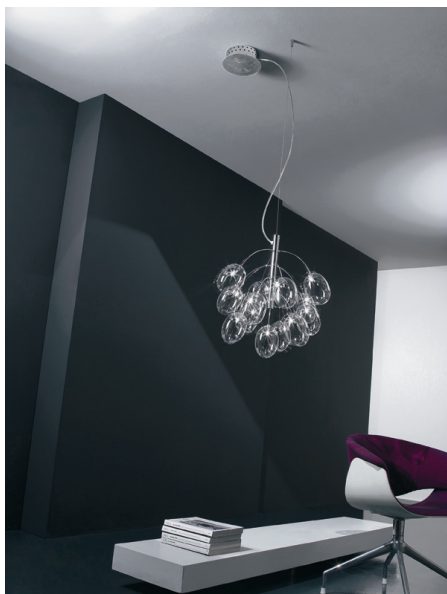
OPROSOS13 Prosecco S13D sospensione decentrata