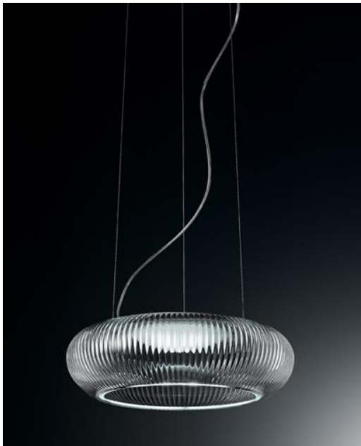
OCANNOS45 Cannettata S42 HALOGEN sospensione