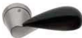
NI/EM Nikelmat/Ebano makassar Matt nickel/Makassar ebony

Le differenze di venatura e colore che si riscontrano sul particolare in legno, sono dovute esclusivamente all'utilizzo di masselli Grain and colour differences you notice on the piece are natural characteristics of the genuine wood