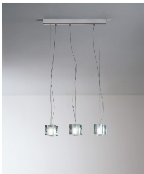
OOTTO0S30 Otto x otto S3L sospensione lineare